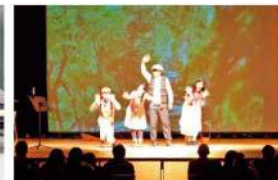
学生による演劇公演