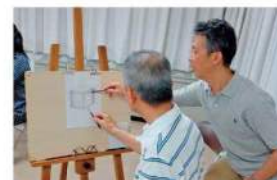
デッサン教室での一コマ