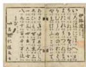
伊呂波 朝鮮版 [弘治5年(1492)刊]