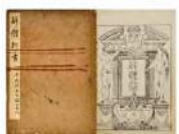
解体新書(小石元俊校正書入) [寛政10年(1798)]